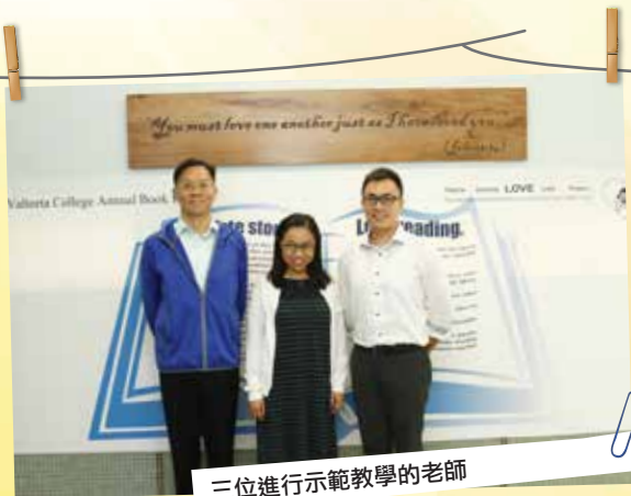
三位進行示範教學的老師

連續三日的開放校園吸引了近六百位來自不同小學的家長、老師、學生蒞臨本校，家長和學生可藉此加深對本校認識，老師則可從觀課活動中切磋教學方法和交流教學心得，實在是一次內容豐富和別具意義的活動。