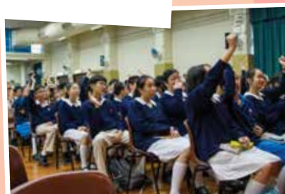
同學在閱讀分享講座中反應熱烈