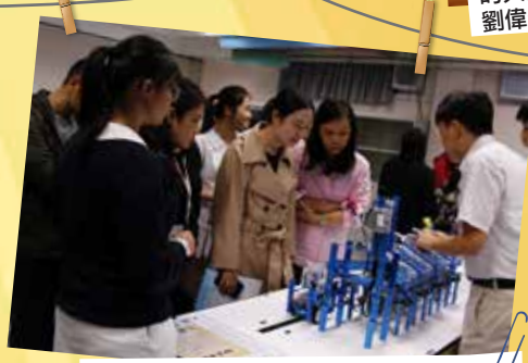
本校同學接待參觀校園的家長