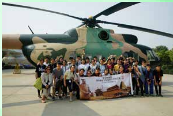
參觀閻良航空科技館