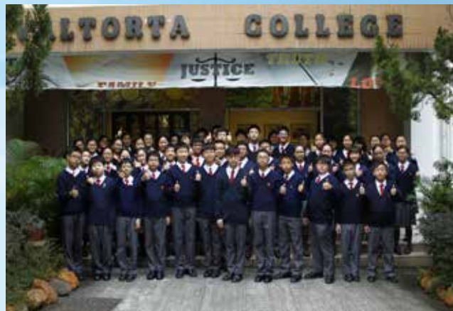
1D班同學獲粵語詩詞集誦冠軍

本校今年派出1D班全班同學參與「第70屆香港學校朗誦節」詩詞集誦比賽，在粵語組中學一、二年級集誦項目中榮獲冠軍。此外，本校也派出中二級同學參與「第70屆香港學校朗誦節」普通話詩詞集誦比賽，在中學一、二年級組別中榮獲冠軍。