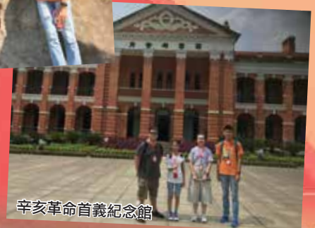
辛亥革命首義紀念館