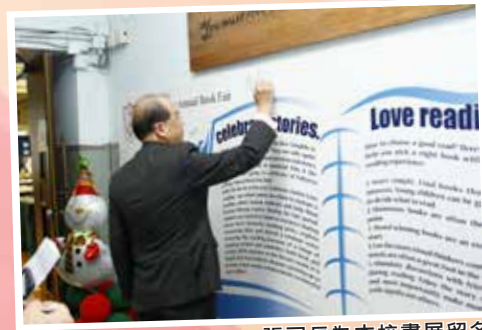
張司長為本校書展留名