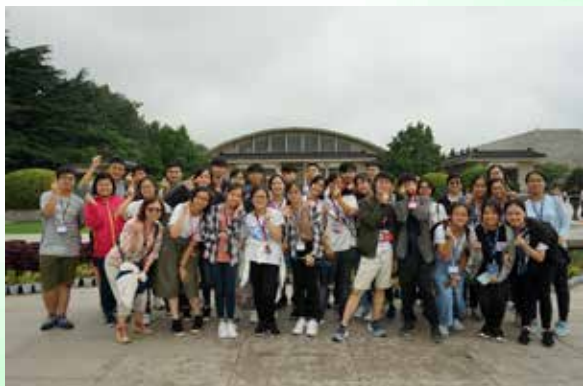
秦始皇陵兵馬俑博物館

二零一八年七月三日，我校四位老師帶領三十二位中三和中四級同學前往西安，展開為期五天的學習之旅。西安是一個歷史文化底蘊深厚的城市，透過不同的參觀考察活動，讓學生認識西安的歷史、重要考古發現及航天科技發展，並欣賞優秀的中華文化，是一次難能可貴的遊學經歷。