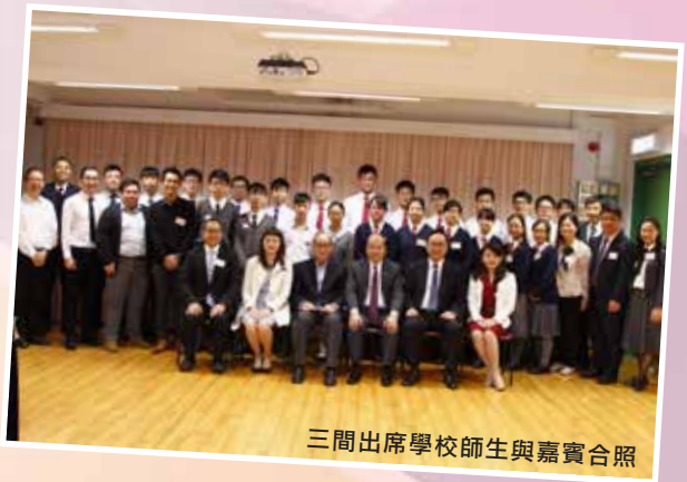
三間出席學校師生與嘉賓合照

之後，一眾嘉賓移步至多用途學習室，與本校、靈糧堂劉梅軒中學及迦密聖道中學的同學會面，了解他們參與這個計劃而創造的創意機械人項目，聆聽他們就香港發展創新科技的看法。此項計劃由香港青年工業家協會資助，旨在提升學生的邏輯思考，啟發他們的創意，為香港培育未來創科人才。當中本校同學向各位來賓介紹其勇奪最佳創意獎的製成品，展現以機械人如何為客人調製各式飲品。兩位嘉賓更即席品嚐由機械人調製的飲品，並勉勵同學再接再厲，繼續在創新科技上作出探索，積極學習。