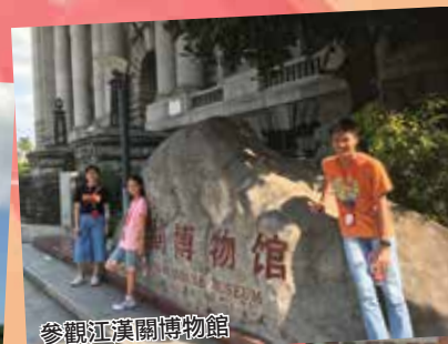
參觀江漢關博物館