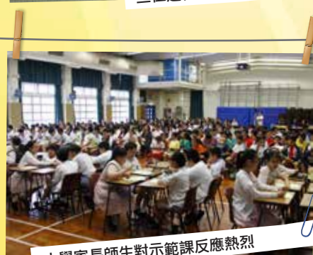
小學家長師生對示範課反應熱烈