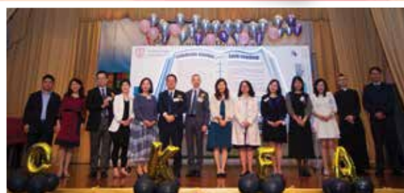
書展開幕禮上校監和校長跟一眾嘉賓合照