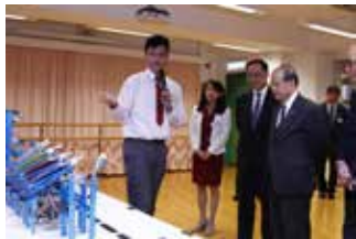
本校同學介紹創意機械人