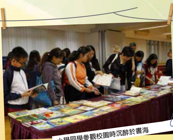
小學同學參觀校園時沉醉於書海