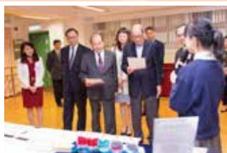
嘉賓聚精會神聆聽同學講解

張建宗司長樂見各同學所展現的創新思維，勉勵年青人要繼續努力，為本港創新科技發展作出貢獻。張司長強調，特區政府致力推動STEM教育，在《施政報告》公布了不少新措施，為學校提供支援，期望同學運用科學與工程的知識，將來應用在不同行業的發展，與國家發展接軌，迎來大灣區作為國際科技創新中心的新機遇，達致中港兩地優勢互補，共同打造一個國際科技創新中心。