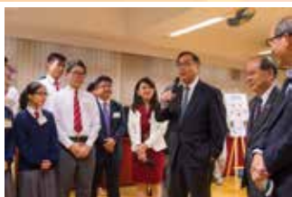
楊局長鼓勵同學在 創新科技上努力學習