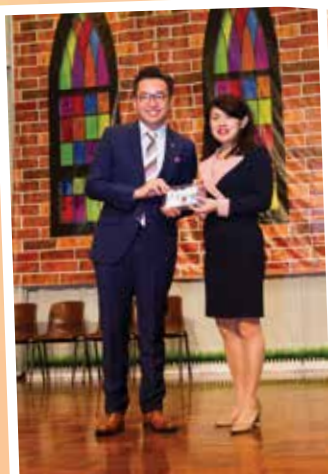
校長頒贈紀念品予講者 楊岳橋大律師