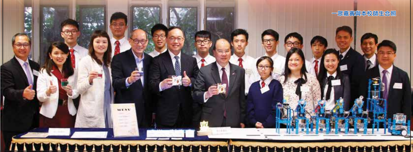
一眾嘉賓與本校師生合照

張建宗司長樂見各同學所展現的創新思維，勉勵年青人要繼續努力，為本港創新科技發展作出貢獻。張司長強調，特區政府致力推動STEM教育，在《施政報告》公布了不少新措施，為學校提供支援，期望同學運用科學與工程的知識，將來應用在不同行業的發展，與國家發展接軌，迎來大灣區作為國際科技創新中心的新機遇，達致中港兩地優勢互補，共同打造一個國際科技創新中心。