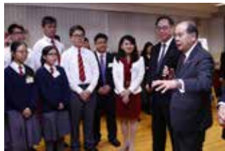
張司長向同學勉勵