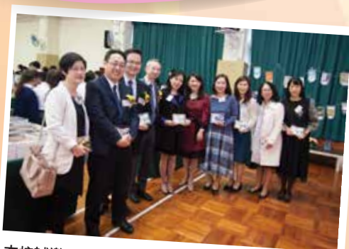
本校誠邀區內九位小學校長擔任主禮嘉賓