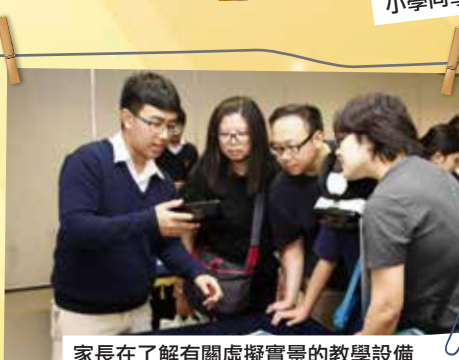
家長在了解有關虛擬實景的教學設備