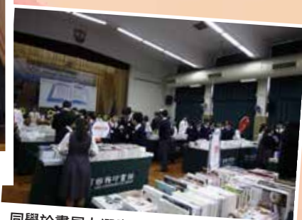
同學於書展上選書、閱書、購書